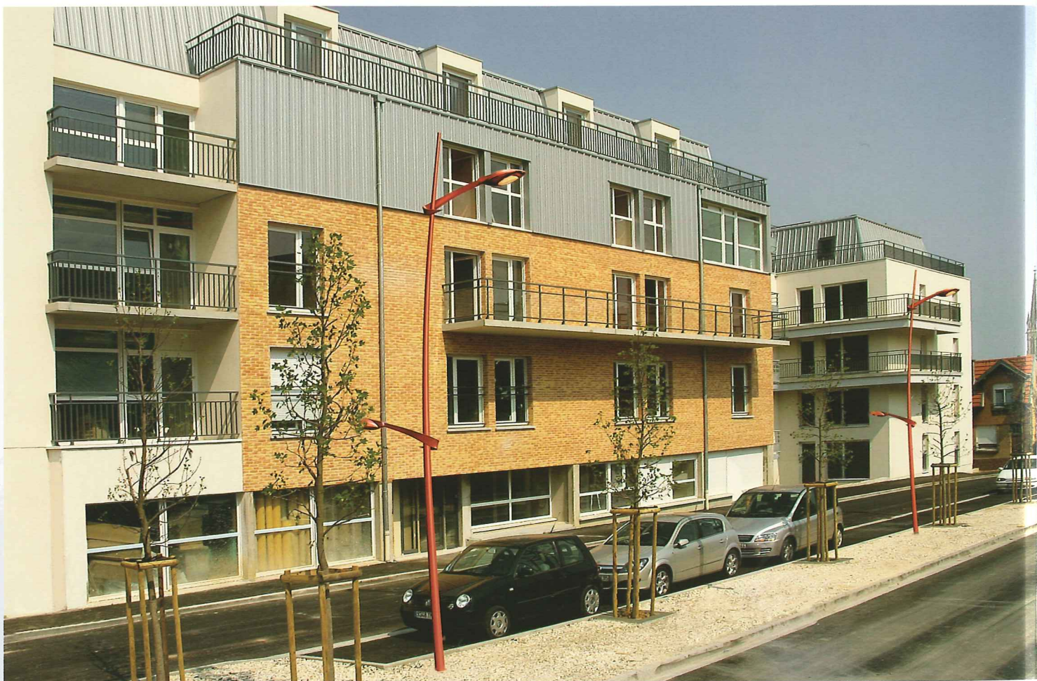
Saint-Pierre droit double console (DC)

Painted coat to be determined when ordering.