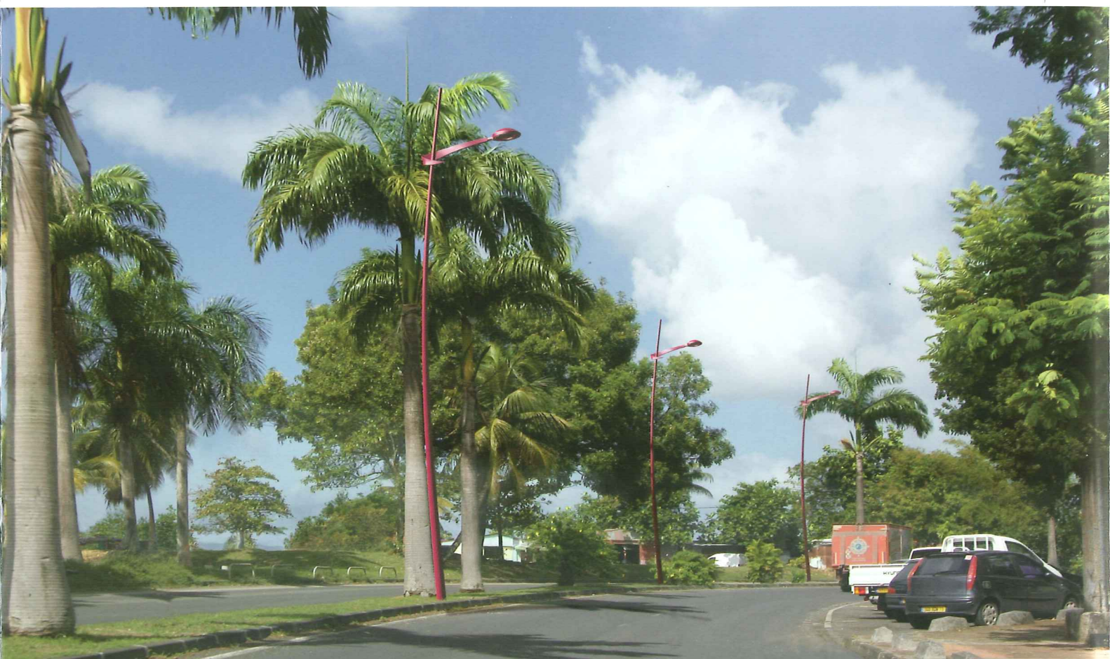
Saint-Pierre droit simple console (SC)