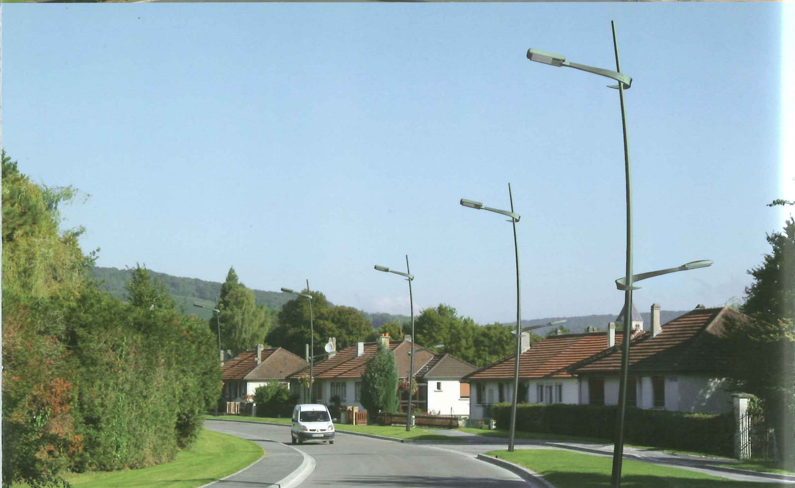
Saint-Pierre droit double console (DC)