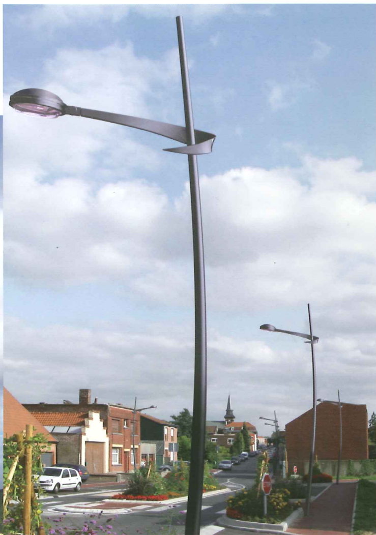
Saint-Pierre droit simple console (SC)