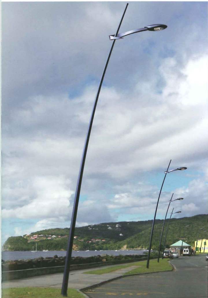
Saint-Pierre incliné simple console (SC)