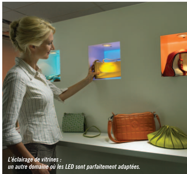
L'éclairage de vitrines : un autre domaine où les LED sont parfaitement adaptées.

NB : Chiffres de performance LED communiqués par LUMILED