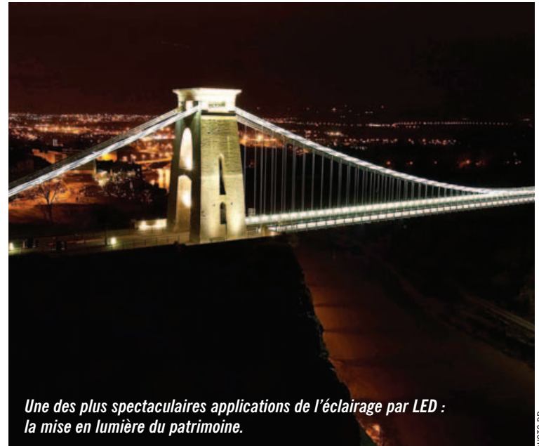
Une des plus spectaculaires applications de l'éclairage par LED : la mise en lumière du patrimoine.